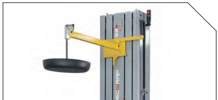
PRESSORE STABILIZZATORE CARICO TOP PRESS PLATE PISON TOP PRESSPLATTE