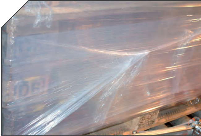
RISULTATO FINALE GRUPPO DI TAGLIO PINZA X-DEP END RESULT OF CUTTING FILM WITH X-DEP SYSTEM RESULTADO FINAL CON SISTEMA DE CORTE CON PINZA MOD. X-DEP ENDERGEBNIS FOLIENENDSCHNITT MIT X-DEP