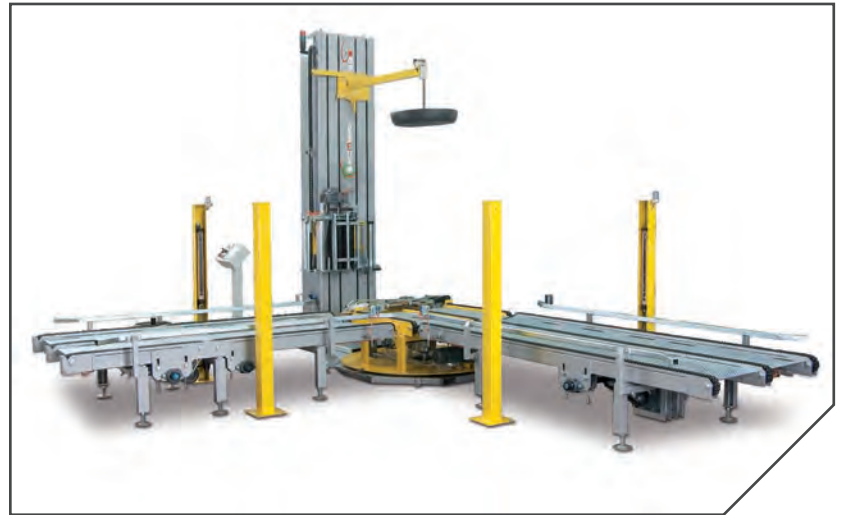
GRUPPO CARRELLO PORTABOBINA REEL-HOLDER CARRIAGE UNIDAD CARRO PORTABOBINA FOLIENWAGEN