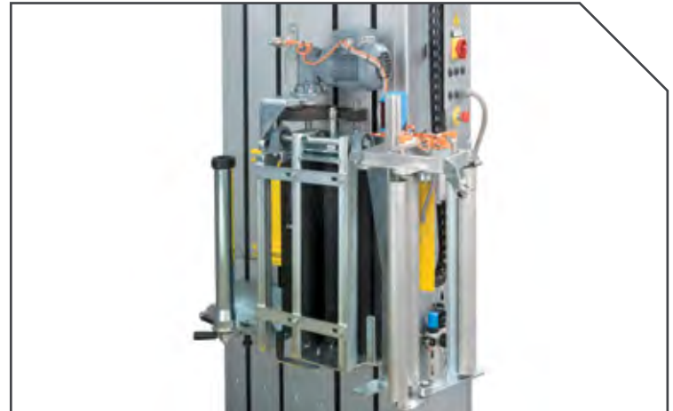
GRUPPO CARRELLO PORTABOBINA REEL-HOLDER CARRIAGE UNIDAD CARRO PORTABOBINA FOLIENWAGEN