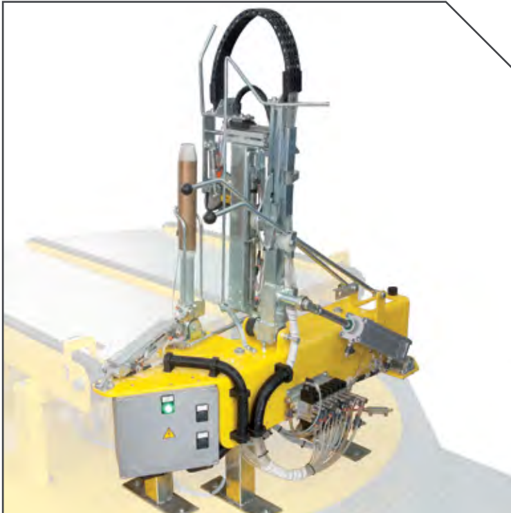
GRUPPO DI TAGLIO ED INFILAGGIO FILM MOD X-DEP (BREVETTATO) CUTTING AND CLAMPING UNIT MOD. X-DEP (PATENTED) PINZA DE CORTE Y INTRODUCCIÓN FILM MOD. X-DEP (PATENTADA) PATENTIERTE VORRICHTUNG ZUM ABSCHNEIDEN UND EINLEGEN DES FOLIENENDES MODELL X-DEP